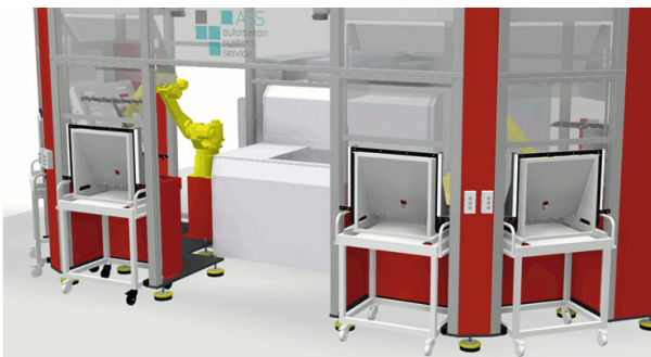
DRS - Stand-alone